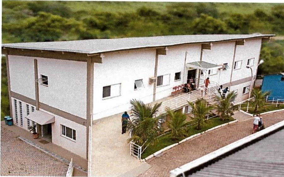
ALA SUPERIOR 09 DORMITORIOS e ALA INFERIOR 11 DORMITORIOS